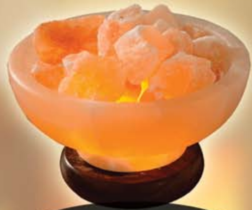
MINGE DE FOC